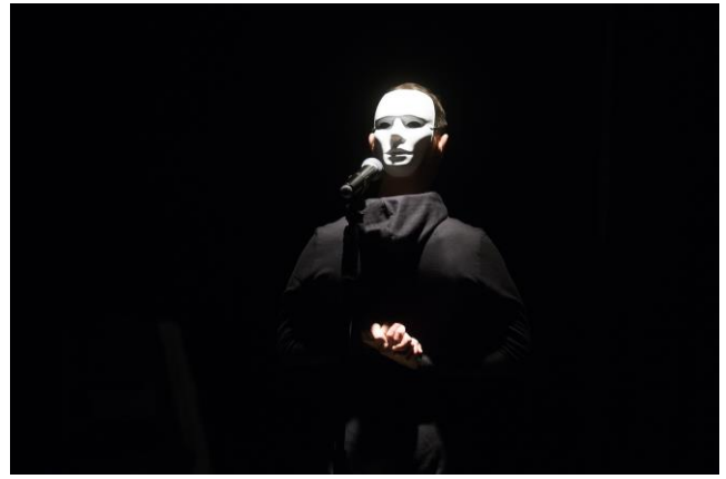
Foto: Dogma Divadlo: Europeana – stručné dejiny 20.storočia, 2017, Radovan Stoklasa