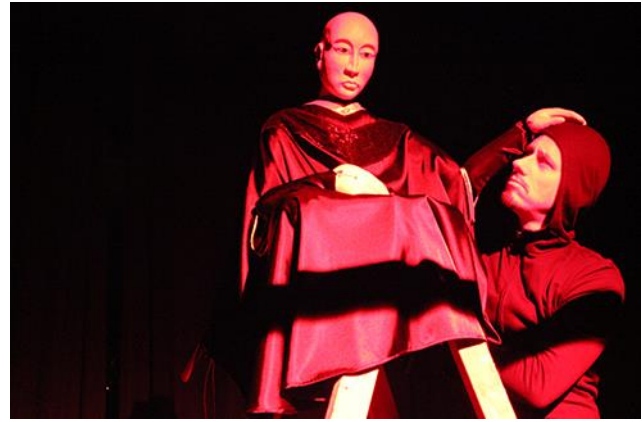
Foto: Divadlo Kolomaz: Stručné dejiny sveta, 2015, Radovan Stoklasa