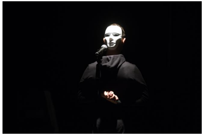
Foto: Divadlo Kolomaž: Europeana – stručné dejiny 20.storočia, 2016, Radovan Stoklasa